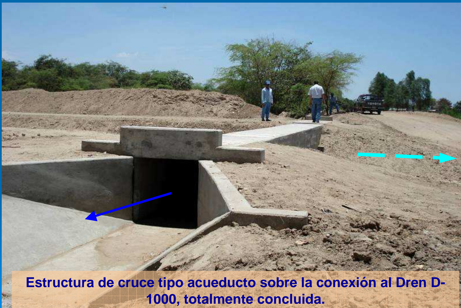
Estructura de cruce tipo acueducto sobre la conexión al Dren D-1000, totalmente concluida.