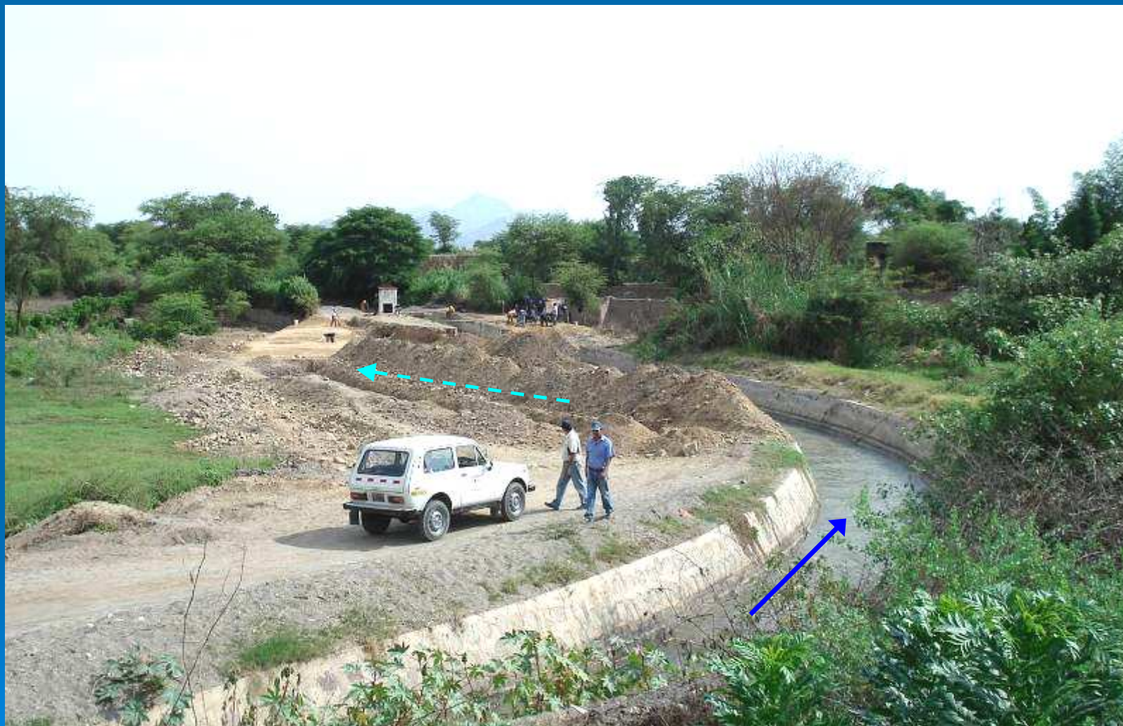
Trabajos en Canal de desvío para obra de cruce Tután – Jarrín con el taymi Antiguo