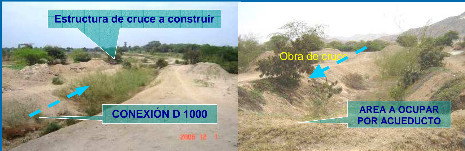
FOTOS DE LA ZONA ANTES DEL INICIO DE LAS OBRAS