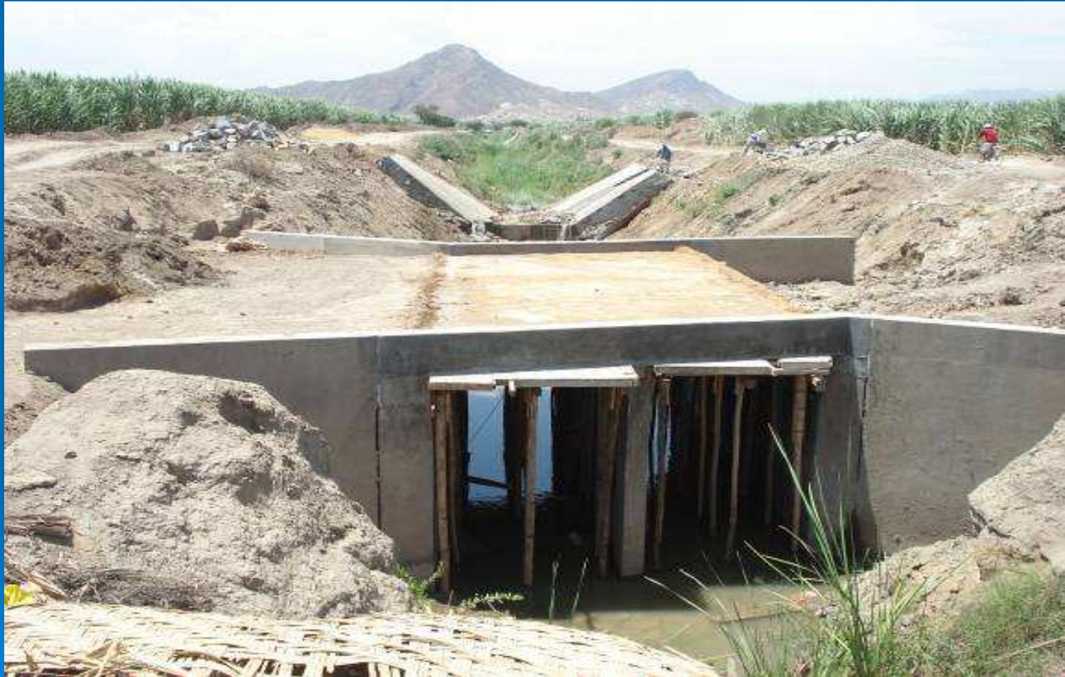
PUENTE ALCANTARILLA CRUCE LUYA MAMAPE – Km 1+537