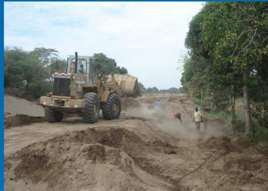
Tramos críticos Chuchicol y Dique