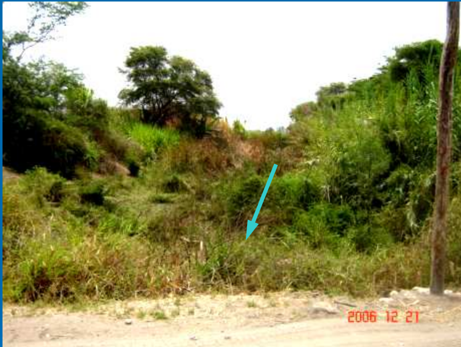
Aspecto que presentaba el Río Taymi próximo a la Conexión, antes del inicio de obra