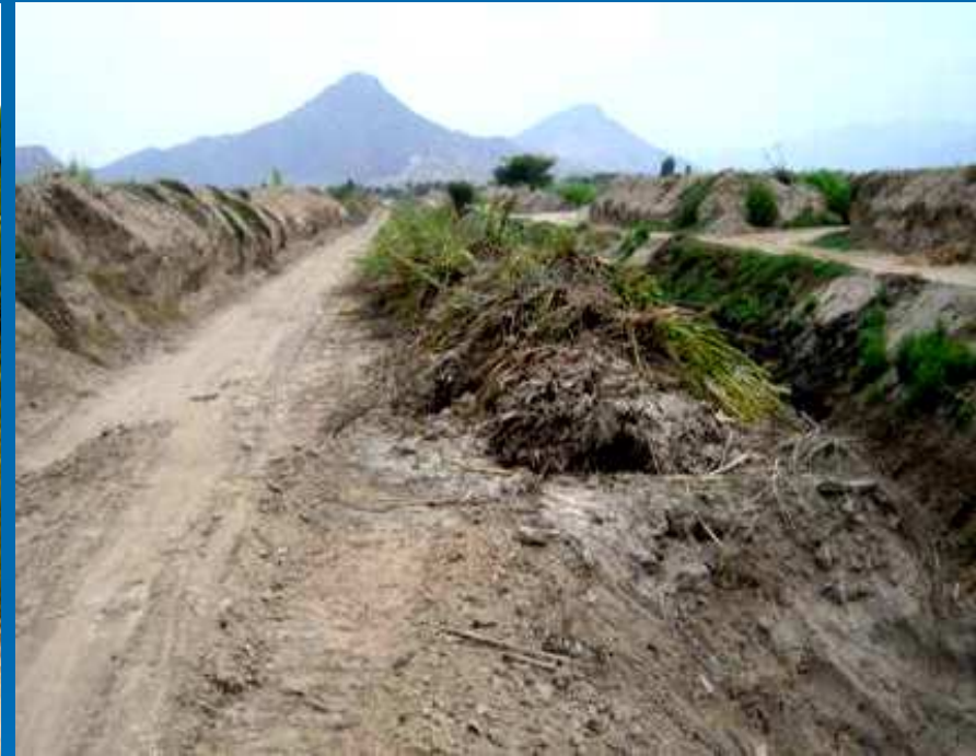
Escombros sobre camino de Vigilancia de la conexión, antes del inicio de las obras