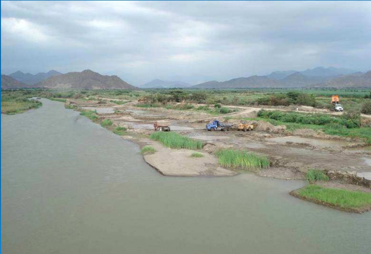
Trabajos de descolmatación en zona de embalse del Partidor La Puntilla